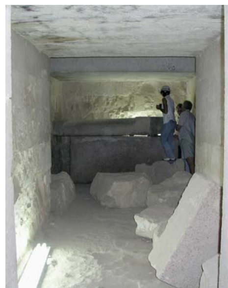
Главный холл, вид из длинного коридора.

Саркофаг из красного гранита (рис.4), возможно, на 50 лет старше саркофага Хуфу и, поэтому, старейший из известных. По сравнению с саркофагом Хуфу, он в три раза толще, длина и высота - те же, а ширина - на 2/3 больше. Вес его - 8,5 тонны, крышки - 3,5 тонны.