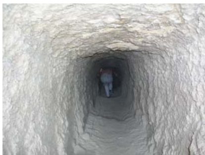
Грабительский лаз с юга мастабы: плавно вниз,

По окончании работы по рытью шахты сквозь мастабу мы встретили давний грабительский туннель, удачливый вор ограбил могилу, прежде чем ее секрет был забыт. Он точно знал место расположения камеры, прорыл с южной стороны около двадцати ярдов от точки ближайшей к помещению, попал точно в конец длинного коридора, и, выломав один камень, вошел, вероятнее всего, с угольным факелом.