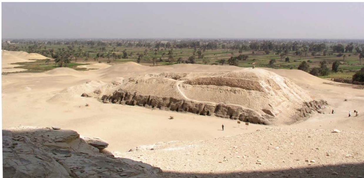
Вид на мастабу с северо-восточного угла осыпи Мейдумской Пирамиды.

Petrie, W. M. Flinders. Meydum and Memphis (III)