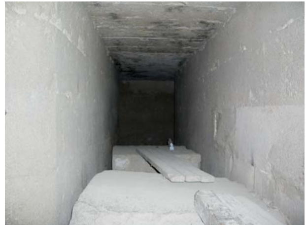
Северный конец длинного коридора. Слева виден скруглённый угол.

Скругления сделаны после завершения строительства стесыванием камня по красным линиям, прочерченным на стенах. Визуальный эффект от смелых широких скруглений - благородная вместительность объемов.