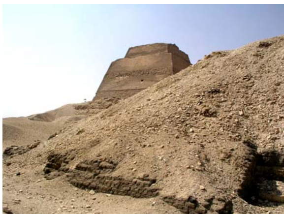
Слева – юго-восточный угол мастабы.

Когда профессором Масперо в 1882 году был открыт фасад, "табличка" на ложной двери, обычно исписанная, оказалась совершенно пустой. Позже дверь была украдена "на камень".