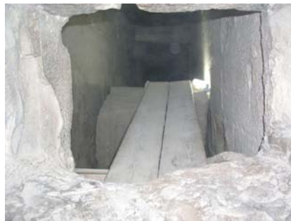
на животе в длинный коридор...