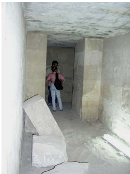
Главный холл, вид от саркофага.

Главный холл - более 20 футов длины, 16 футов высоты и 7 футов ширины. Здесь над проходом и нишей видны гигантские бимсы перекрытия. Размеры : 218 - длина, 103,5 - глубина и 50 дюймов - ширина, вес, т.о., - 38 тонн.