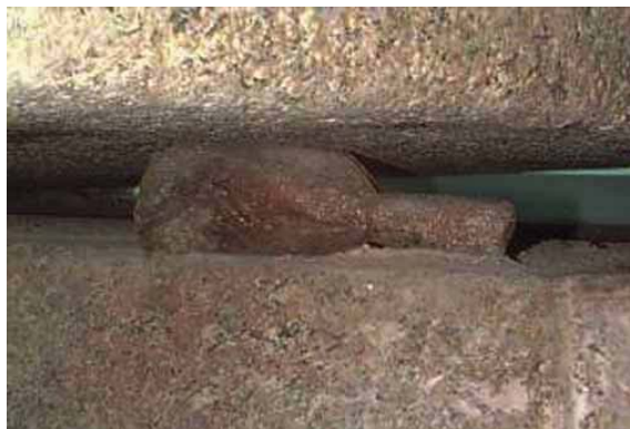
Окаменевшая колотушка под крышечкой

Рычаг, с помощью которого крышка была сдвинута, был найден в северном конце камеры. Это - просто ветка от sont ( акация ) длиной около 6 футов и около 2,5 дюймов в диаметре, заостренная на конце лезвием резца. Мистер Айртон сказал мне, что она - точно такая же, какая использовалась с той же целью в гробнице Хоремхеба в Фивах.