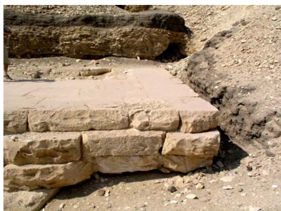
Справа - за правым краем «порога», раскопанного Масперо, был главный раскоп Питри.

Полный размер мастабы по уровню фундамента - 4122x2064 дюйма, или 200x100 локтей. Внешняя поверхность мастабы была из черного кирпича, а внутренний объем - из обломков чистого камня и мергеля, уложенных в регулярные слои строителями граничащей с ней пирамиды.