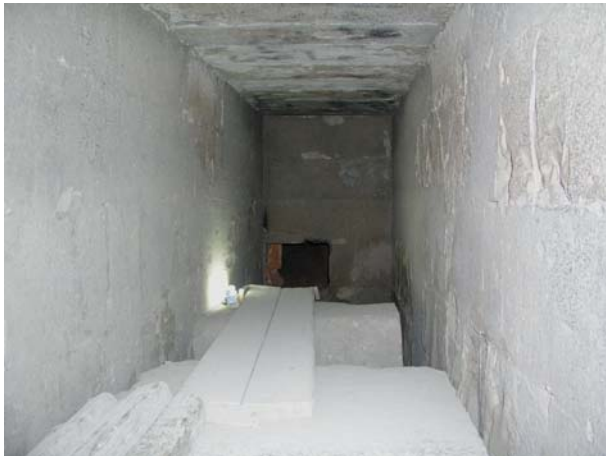
Южный конец длинного коридора.

Интерьер гробницы - благодатная часть работы. Длинный коридор - около 8 футов высоты, 4 футов ширины и более чем 40 футов длины. Скругленные углы дверных проемов - не встречавшегося нигде типа. Назначение их не ясно, поскольку саркофаг слишком велик, чтоб пройти коридоры, и должен был быть "встроен", а внутренний гроб не столь велик, чтоб не смочь пройти углы.